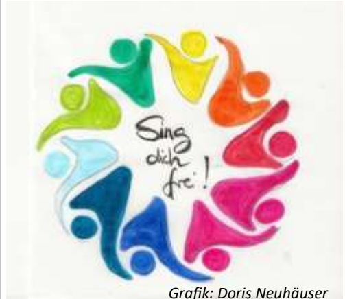
Grafik: Doris Neuhäuser

doris.neuhaeuser@gmx.de oder Telefon: 06732 / 8347